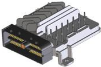
fig 1. På bilden ser du den senaste typen av Allison TCM, den så kallade GEN 5 TCM.

Allisons Transmissioner har under åren genomgått ett antal förändringar och uppdateringar. Nu börjar GEN 5 och tillhörande växellådsstyrning finnas ute på bred front. Dessa kräver lite utökad dokumentation vid beställning av ersättnings TCM.